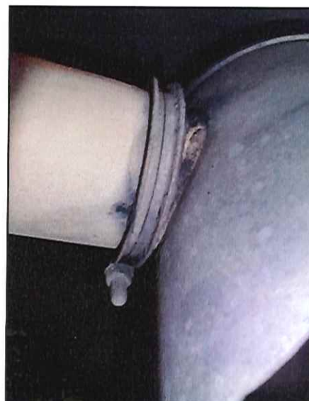
Local: Chassi Item # 36: silencioso do escape quebrado no tubo de saída.