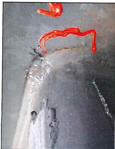
Local: Spreader Item # 19: pequena trinca no T da asa do spreader.