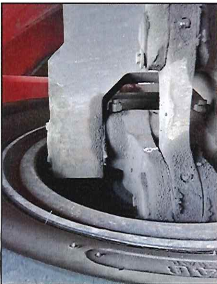
Local: Direção Item # 39: calço deslizando do pino da manga de eixo do lado esquerdo está solto. Status: corrigido .