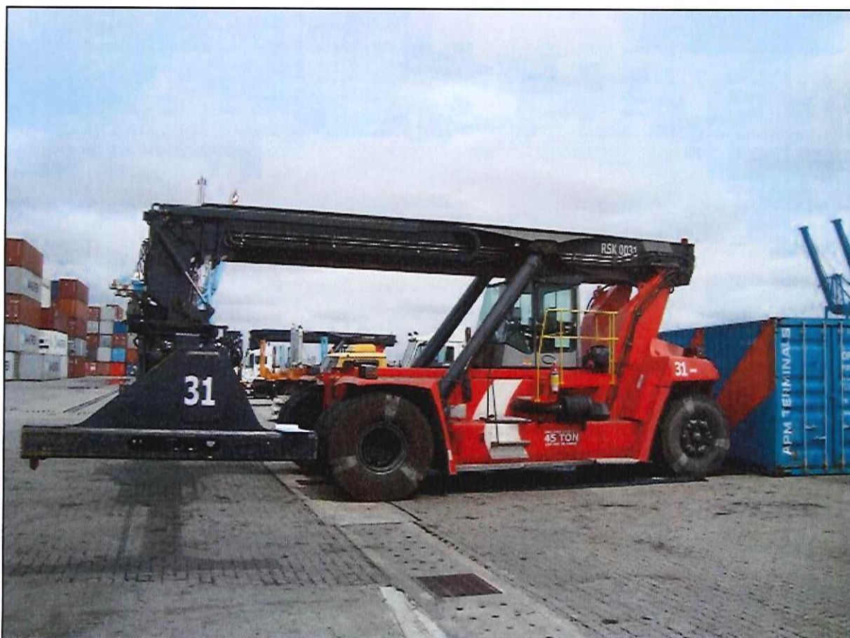
Figura 1. Empilhadeira de grande porte (Reach-Stacker), RSK-0031.