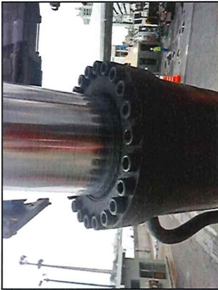
Local: Lança Item # 42: vazamento de óleo pelo cilindro de elevação da lança, lado esquerdo. Status: corrigido .