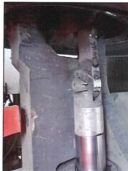
Local: Direção Item # 39: pino de junção do link de direção lado direito solto (parafuso de fixação quebrado). Status: corrigido .