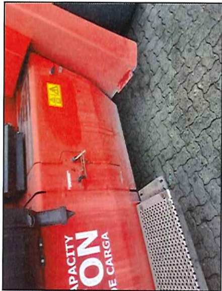
Local: Chassi Item # 30: falta um dos estribos do lado direito da máquina (lado oposto ao acesso à cabine).