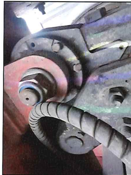
Local: Direção Item # 39: desgaste nos componentes da bucha da balança de direção.