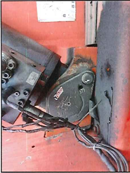
Local: Lança Item # 42: vazamento de óleo no bloco hidráulico do cilindro de elevação, lado esquerdo. Status: corrigido .