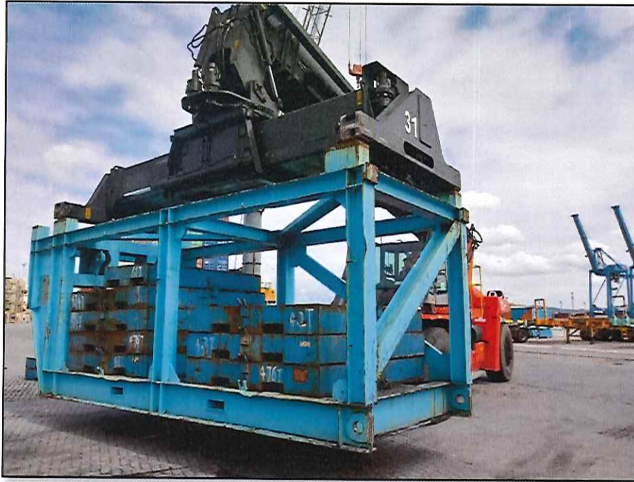
Figura 3. Teste de carga.